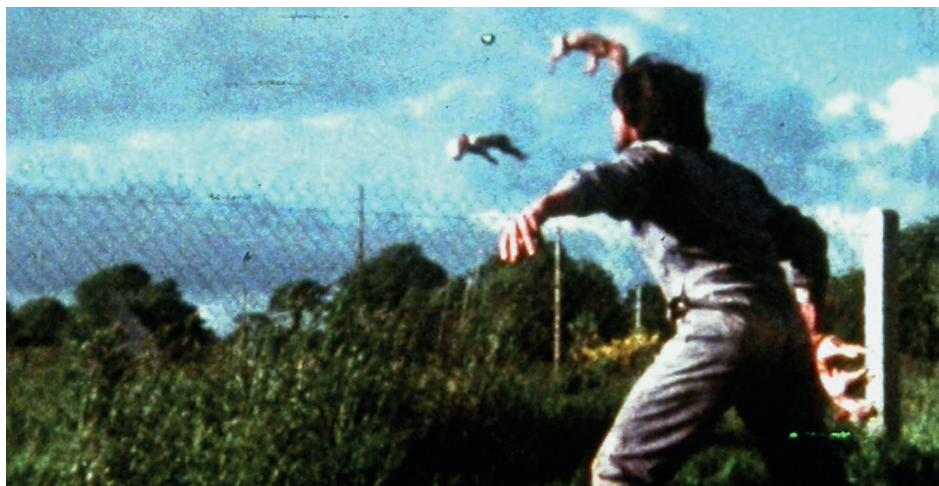
Jean-Louis Le Tacon, Cochon qui s'en dédit , 1979

– Cinéma Arvor 11 rue de Chatillon, 35000 Rennes