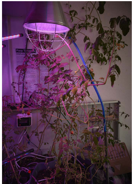
atelier du ventre, poop tomatoes , installation, 2025