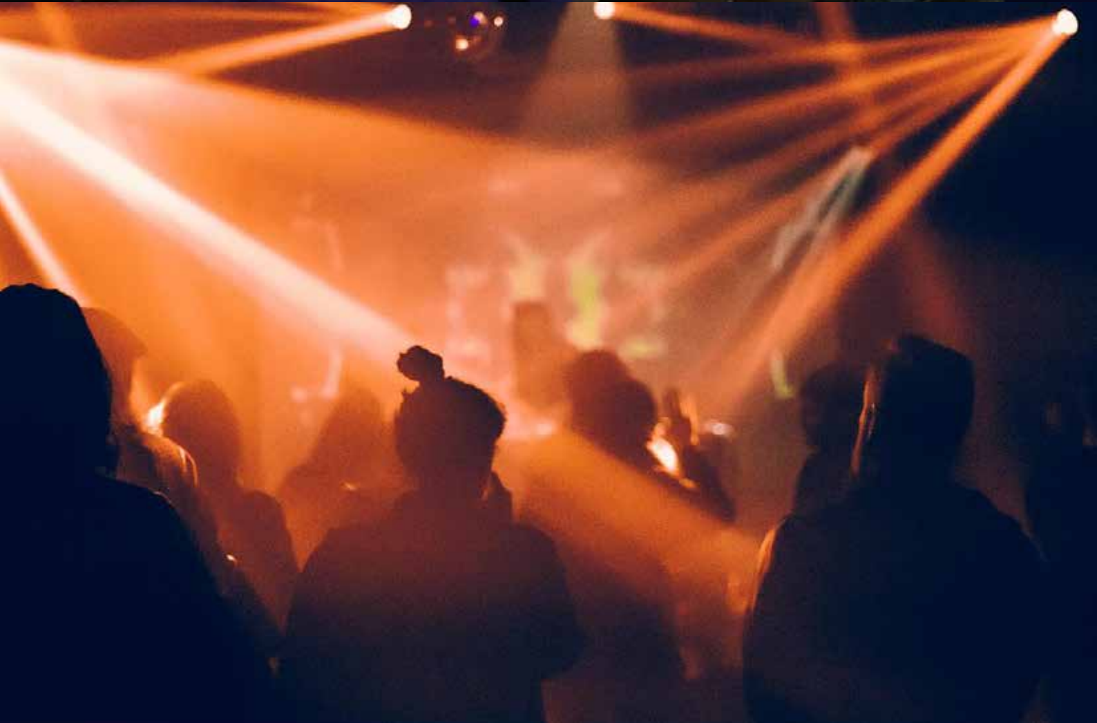
What Shadow? ce que dit la bouche d'ombre, exposition aux Ateliers du Vent, juin 2024 Buvette Rêve Party, Emotional Space, avril 2024